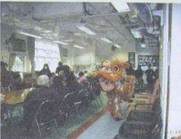
新年期間，舞獅到咁與長者拜年。