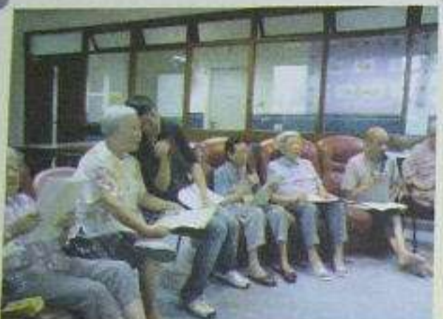
經典金曲，共你唱遊當年情懷。