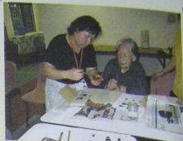
大筆一揮，小鳥即成！