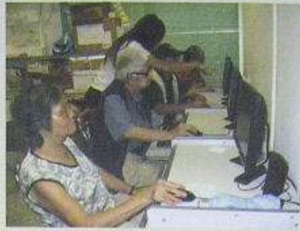
電腦導師正認真教授長者呢！