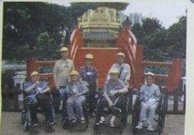
南蓮園池內樹木珍貴，長者身後建築物據聞是用金鈎興建的。