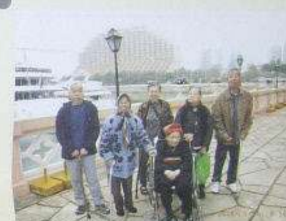
長者到達黃金海岸感受陽光與海濤氣息，共渡午餐。