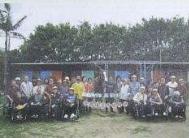
為迎接奧運馬術，長者們也出動與馬仔接觸。