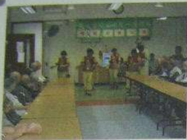
雙親節一同為父親和母親慶祝，義工表演落力非常！