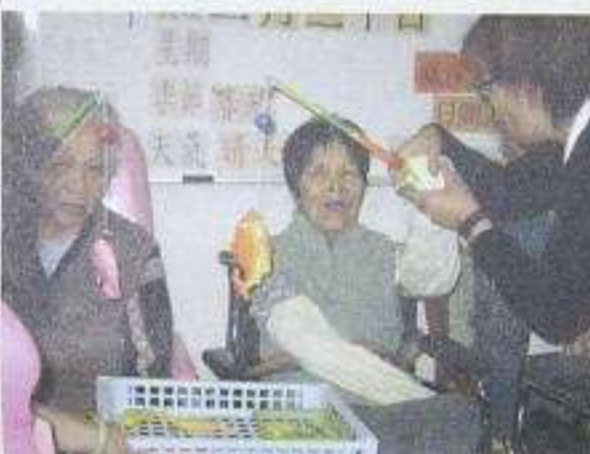
教善義工教院友玩釣魚遊戲，大家玩到笑逐顏開！