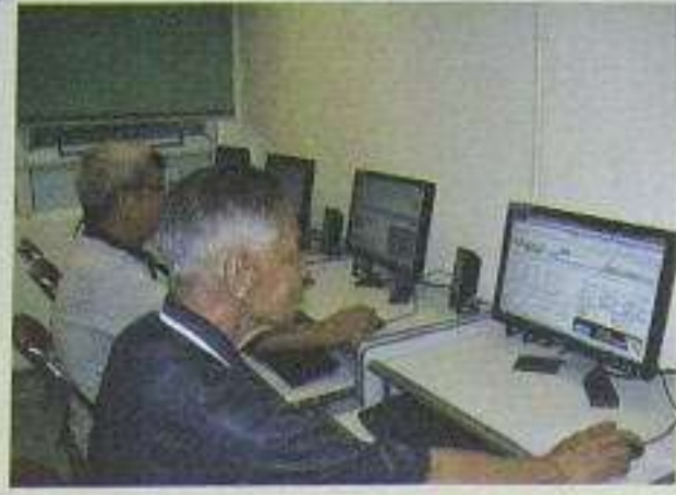
長者們正學習上網瀏覽各種資訊