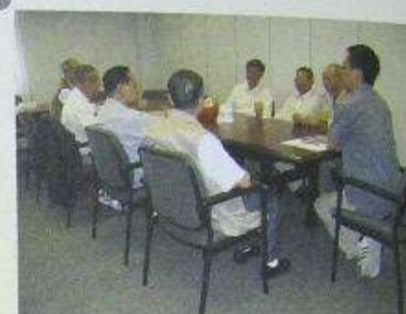
男士組各人在集會暢談的情景