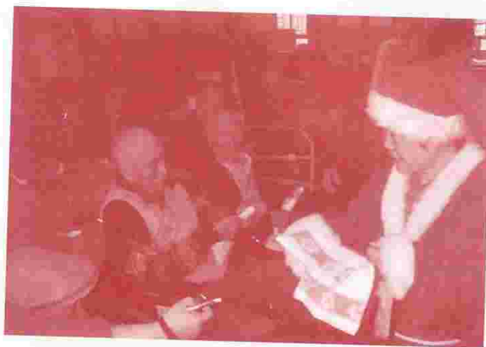
聖誕老人來了，大派禮物，人人有份，永不落空