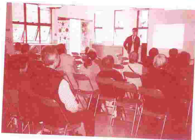
鄉郊探訪隊與社區義工為鄉村村民送上關懷