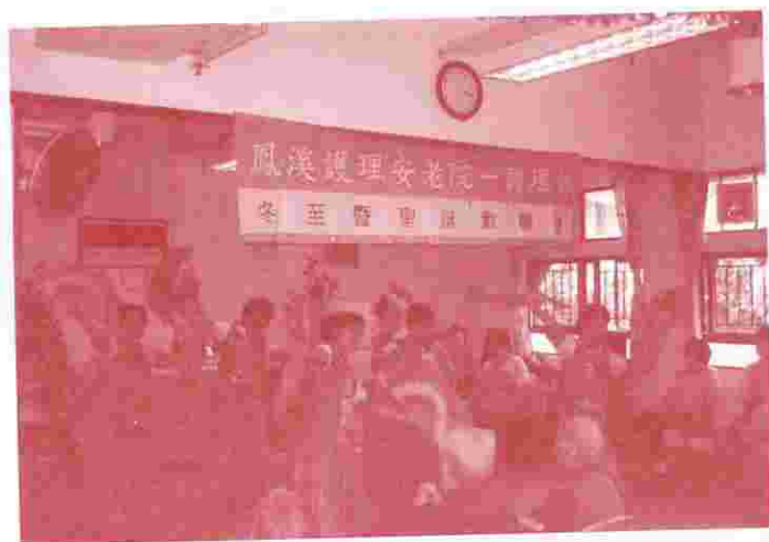
與院友一同慶祝聖誕和冬至，有所謂冬大過年，故大家都落力表演和投入欣賞