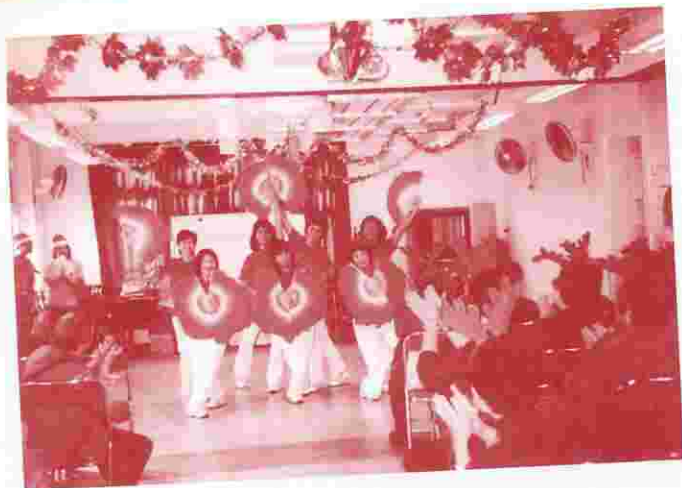
聖誕「善」妙派對，善英開心多樂趣