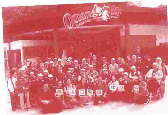
長者們十分享受海洋公園之旅