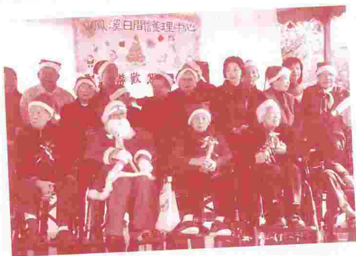
能與聖誕老人開Party，真開心