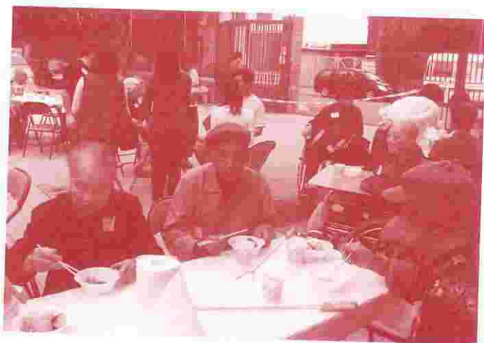
院友們和家屬們共聚燒烤同樂日