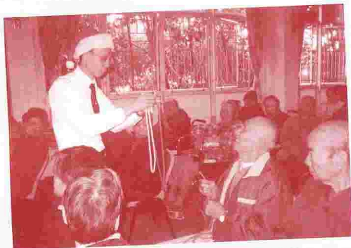
基督教耆福會前來探訪，大玩魔術， 更找院友做助手，個個睇得全神貫注