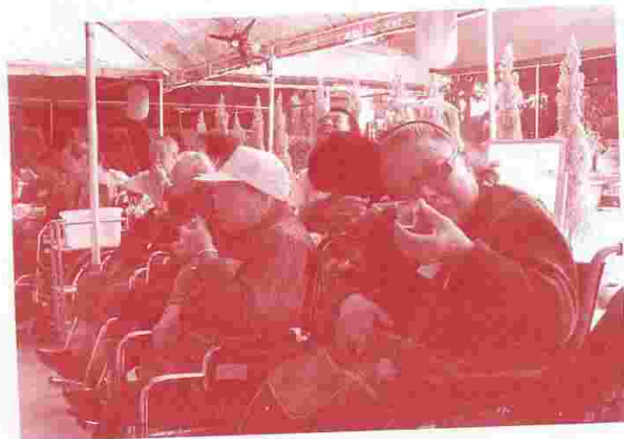
一起郊遊香薰園，細味品茗閒情